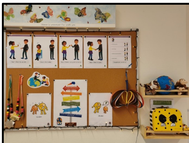
de vreedzame school